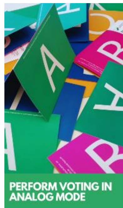
Announcement text with all information on this page .